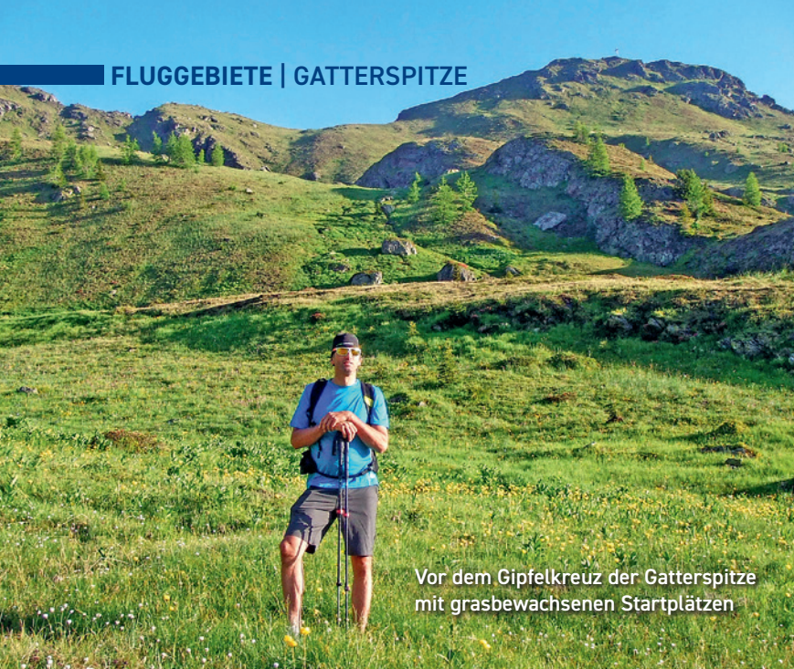
Vor dem Gipfelkreuz der Gatterspitze mit grasbewachsenen Startplätzen