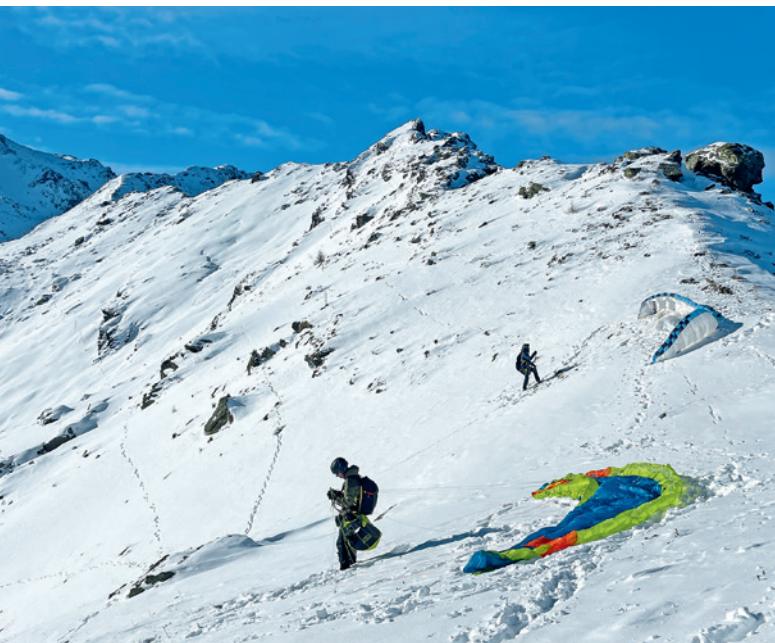
Startvorbereitung im Winter