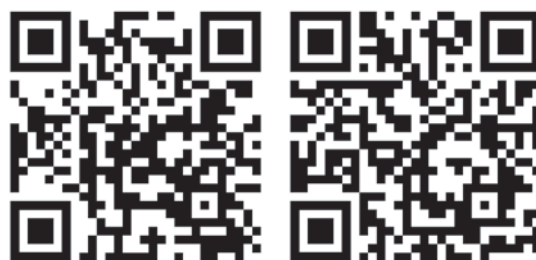
Film zu Gatterspitze