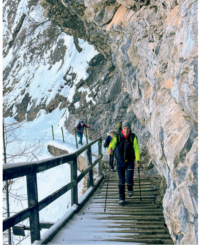
Der Weg durch den Fels