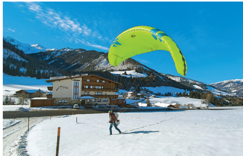
Landung am Monte mit Ultralite

noch Grödel anlegen. Spätestens beim Aufstieg durch die Steilflanken in der zweiten Hälfte der Tour verbessern sie spürbar die Trittsicherheit. Devise: unnötige Risiken vermeiden. Die Wetterbedingungen für den heutigen Tag sind nahezu perfekt.