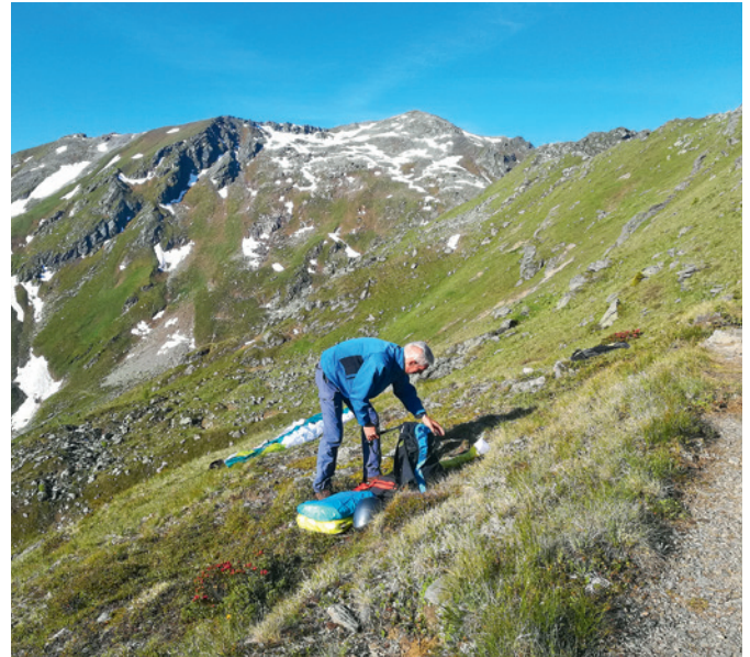
Startplatz im Sommer

Landeplatz: Landemöglichkeiten auf den Wiesen gegenüber dem Aparthotel Monte entlang der B 111 vor Ortseingang Kartitsch