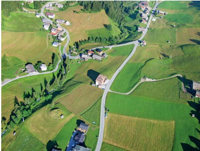
Monte mit Landewiesen